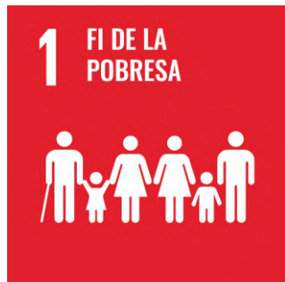
Posar fi a la pobresa .