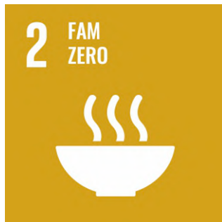
Posar fi a la fam .