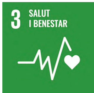
Garantir una vida sana i promoure el benestar .