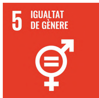
Igualtat de gènere i apoderar totes les dones i nenes.